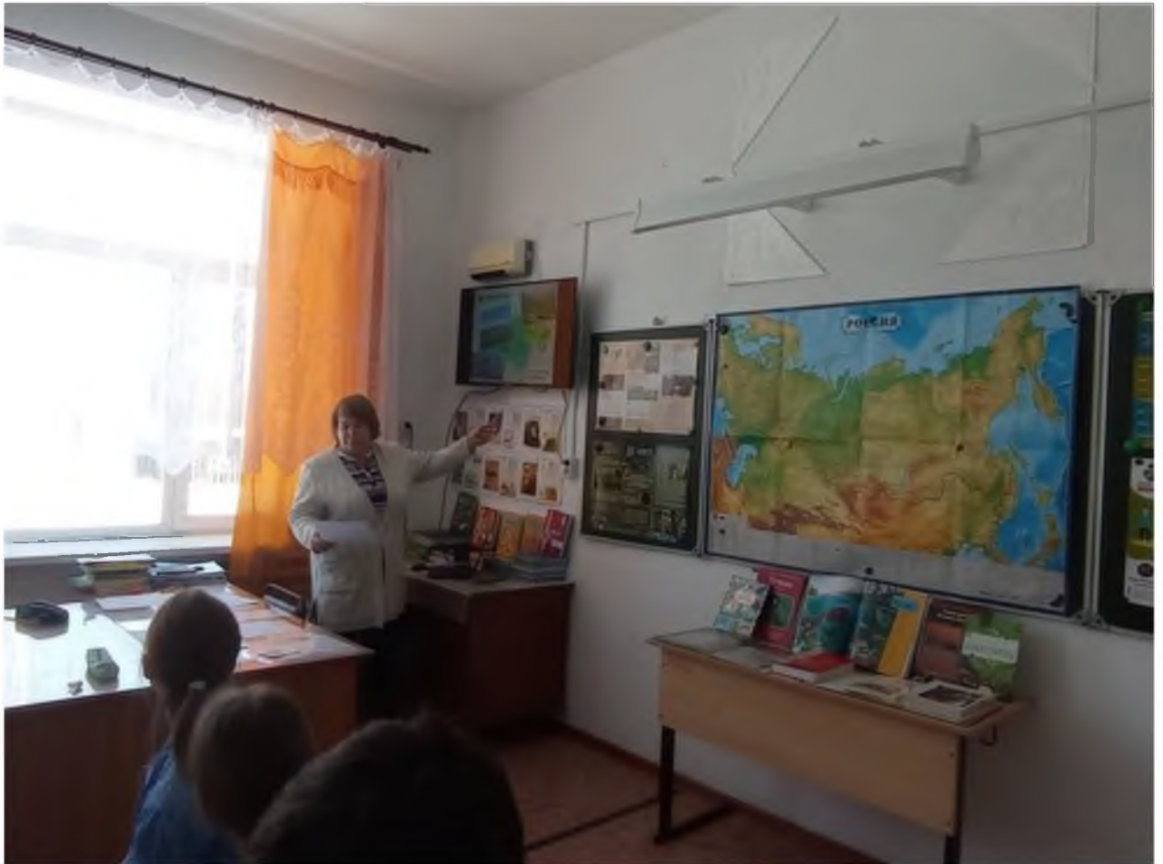
Индивидуальное занятие по географии по модели наставничества «Учитель-ученик»